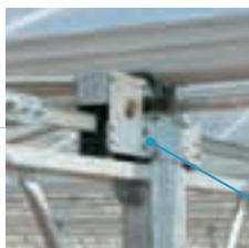
Fiabilité : relevage par crémaillères

sont conçues et adaptées aux critères de culture actuels afin d'optimiser l'aération et la luminosité selon votre type de culture.