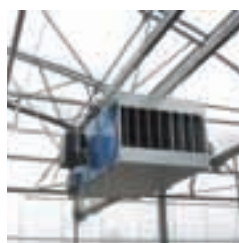
Générateur d'air chaud