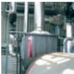
Récupérateur à condensation