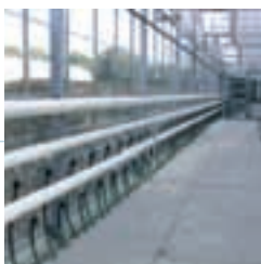
Chauffage au sol