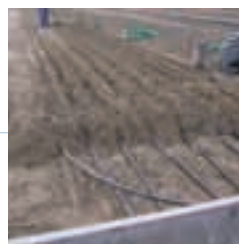
Basse et haute température