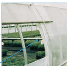
Aération latérale par enroulement

ou pleine terre, bénéficiez des tunnels plastique ogive. Equipement courant en maraîchage et horticulture, les tunnels ogive vous offrent une fonctionnalité exceptionnelle.