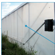
Un piédroit supérieur aux tunnels piédroits.

convient parfaitement à toutes les cultures en maraîchage et horticulture. Elle apporte une fonctionnalité exceptionnelle supérieure aux tunnels piédroits. Sa conception permet un montage simple et rapide.